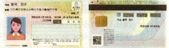
個人番号カードイメージ

個人番号カードにはマイナンバーも記載されています。顔写真付きなので本人確認資料としても使用できます(初回交付は無料)